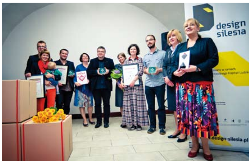
Laureaci siódmej edycji konkursu „Śląska Rzecz”.

W kategorii projekt graficzny nagroda trafiła do Fundacji „Brama Cukermana” z Będzina za „Opowieści nieobecnych” - serię audioprzewodników po dziedzictwie żydowskim w miastach Województwa Śląskiego. Jury w werdykcie podkreślało m. in. „minimalistyczna oprawa strony internetowej i druków