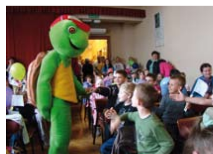
Dzieci cieszyły się z wizyty ulubionego bajkowego bohatera.

Wierzmy, że wspólne zaangażowanie się w organizację tego eduka-