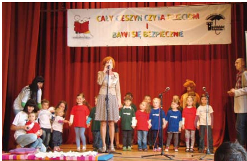
Co roku podczas Festiwalu dorośli namawiają dzieci do czytania, a sami świącą przykładem.

Po uroczystej inauguracji nadszedł czas na zabawę, występy artystyczne, warsztaty regionalne, archeologiczne i językowe oraz inne atrakcje, którym obowiązkowo towarzyszyło głośne czytanie. Ponieważ współorganizatorem imprezy „Cały Cieszyn czyta dzieciom i bawi się bezpiecznie” była cieszyńska Straż Miejska i przedstawiciele pozostałych służb mundurowych – policjanci, strażacy i pogranicznicy, nie lada atrakcją stanowiły również pokazy samochodów służb porządkowych, pokaz tresury psów policyjnych oraz zabawy i konkursy, których celem było kształtowanie u dzieci nawyków i postaw podnoszących bezpieczeństwo własne i innych. O bezpieczeństwie przypomniał również zespół Ploom, który zagrał w sali widowiskowej Cieszyńskiego Ośrodka Kultury. Dzieci, słuchając PLOOM'a, starały się zapamiętywać alarmowe numery telefonów, uczyły się ostrożności w kontaktach z nieznajomymi, a także: jak powiedzieć „nie” używkom, jak szanować mienie publiczne oraz - jak uwierzyć w siebie. Wiele dorosłych i dziecięcych fanów zgromadził występ uczniów Centrum „Helen Doron”. Maluchy, w towarzystwie Kangura – maskotki HD tańcem i śpiewem w mig przekonały wszystkich, że czy-