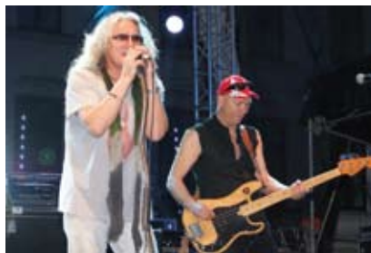
W piątkowy wieczór dla Cieszynian zagrał Perfect.