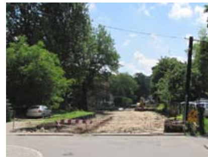
Trwają prace nad budową nowego odcinka ul. Pokoju.