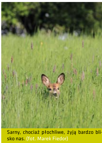
Sarny, chociaż płochliwe, żyją bardzo blisko nas.

Każdej wiosny wiele młodych, zdrowych zwierząt – zwłaszcza saren, jest zabieranych przez troskliwych ludzi do domów. Większość z tych interwencji jest zupełnie niepotrzebna, a wynika najczęściej z poczucia empatii i niestety braku wiedzy o biologii danego gatunku.