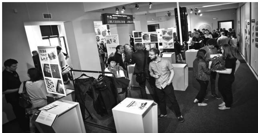
Stała wystawa „Dizajn po Śląsku. Laureaci konkursu Śląska Rzecz” w Zamku Cieszyn już otwarta.