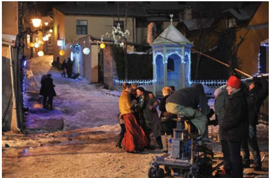
Filmowcy pokochali Cieszyn.

Zdarzenia te, w dowcipny i magiczny sposób, pozwalają bohaterom spojrzeć na swoje życie z innej strony, na nowo je przemyśleć, zobaczyć w innym świetle, wreszcie zmienić je na lepsze.