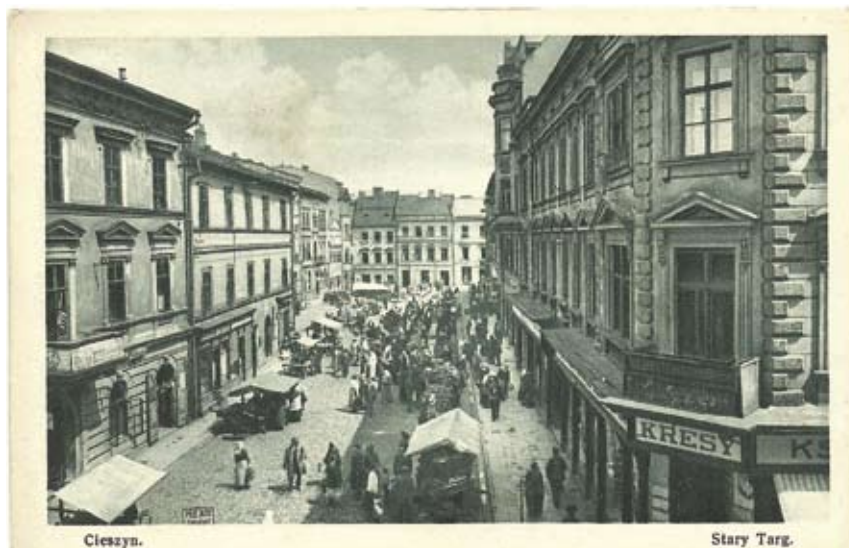
Siedziba Księgarni „Kresy” mieściła się w narożnym lokalu na rogu Starego Targu i ul. Głębokiej.

Księgarnia rozpoczęła działalność ze sporym rozmachem. Na półkach w jej lokalu przy Starym Targu 14 znalazł się obfity wybór podręczników szkolnych (choć w ofercie „Kresów” nie brakowało też książek beletrystycz-