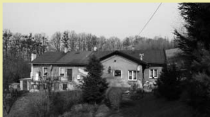
Lokal mieszkalny na ul. Dzikiej przeznaczony na sprzedaż.

Burmistrz Miasta Cieszyna ogłasza, że w dniu 16.07.2012 r. o godz. 10.00 w sali nr 13 Urzędu Miejskiego w Cieszynie odbędzie się ustny przetarg nieograniczony na sprzedaż lokalu mieszkalnego nr 2 o pow. 64,50 m 2 położonego w budynku nr 9 przy ul. Dzikiej w Cieszynie wraz z udziałem w wysokości 645/2811 w częściach niewydzielonych budynku oraz działki nr 45 obr. 63 o pow. 0,1599 ha.