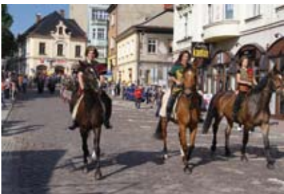
Świętu towarzyszyła wyjątkowo piękna aura.